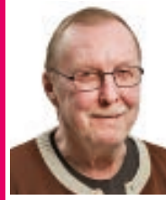
201 Istala Kari FK, eläkeläinen