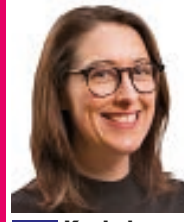
219 Koskela Ashten tutkija (sit.)