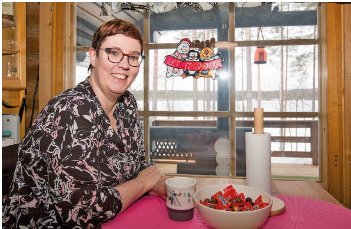
Merja Kyllönen on toiminut kansanedustajana, ministerinä ja Euroopan parlamentissa, mutta korostaa että kuntavaaleissa ratkaistaan nimenomaan oman kunnan asioita.

Kattava palveluverkosto vaatii rahaa ja se raha tulee siitä, että aluetalouden rattaat pysyvät liikkeessä. Kainuussa alkaa olla haaste siinä, että tietyillä aloilla esimerkiksi teollisuudessa on jo työvoimapula.