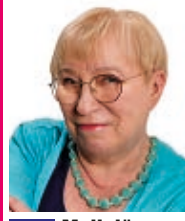
234 Myllylä Raii toiminnanjohtaja, eläkeläinen